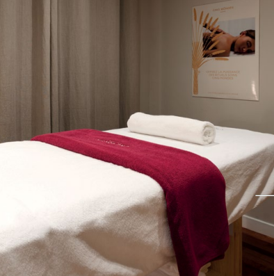
SPA Cinq monde